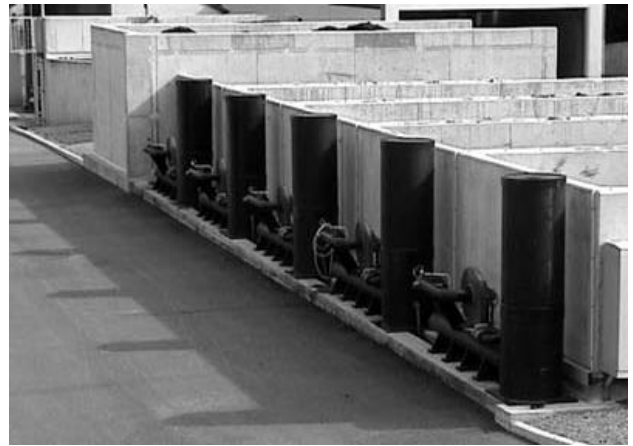
L'exemple du site de compostage de Semur-en-Auxois que nous avons visité en septembre 2005. Au premier plan les dispositifs qui filtrent les odeurs du compostage. Efficace!

La surprise de la réunion est venue de Lingenheld. Leur représentant a d'abord produit la prestation d'un cabinet de consultants canadiens, dont les représentants très sûrs d'eux ont présenté une étude assez superficielle, qui a conclu, après « modélisation » que les odeurs n'existaient quasiment pas ! Leur exposé a cependant été remis en cause, notamment par le représentant de l'ASPA, dont tout le monde reconnaît le sérieux et la compétence. Et pourtant, malgré ces « faibles » odeurs, le représentant de Lingenheld a annoncé qu'ils allaient investir 1 million d'Euros sur le site d'Oberschaeffolsheim pour y installer un système... analogue à ce qu'ARBRES avait vu à Semur-en-Auxois en septembre 2005 et dont nous suggérions l'installation sur le site de la Musau (voir notre article dans ARBRES INFOS n°30). Rappelons qu'il s'agit d'une aspiration pilotée, suivie d'une filtration des odeurs se dégageant des andins. Lingenheld tient enfin compte des observations qui lui sont faites depuis des années, en traitant les odeurs à la source, en les