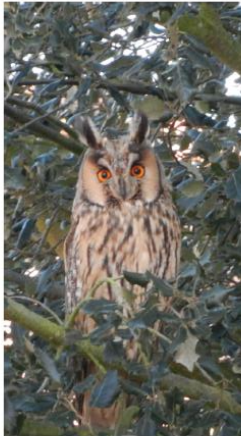
Moyen Duc à Oberschaeffolsheim

ARBRES propose donc une prolongation du tram jusqu'à l'arrivée du COW avec une station d'arrêt du TSPO et un parking-relais.