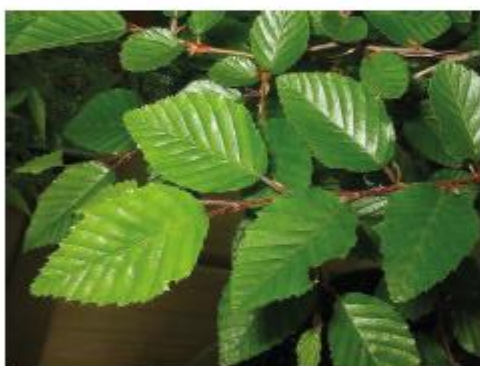
Charme : D'aspect plissé, la feuille présente un pourtour finement dentelé.

Ce sont de grands arbres, jamais très vieux car leur durée de vie dépasse rarement 150 ans, et qui abondent dans nos forêts et aux abords de nos routes et jardins. Le hêtre est souvent dans un environnement froid et brumeux. Le charme est plus connu dans les jardins à la française sous forme de haie