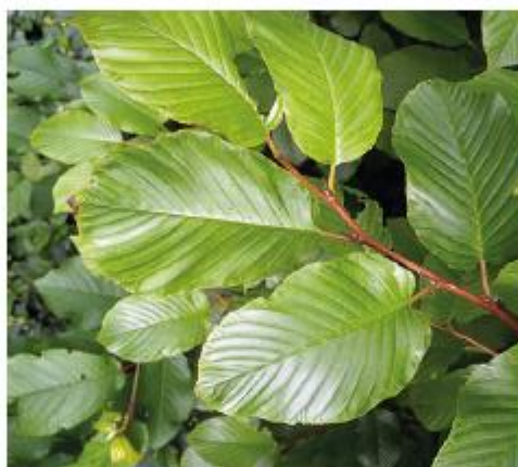
Hêtre : Lisse et brillante la feuille est ciliée, c.à.d. quelle est bordée de poils (cils) sur sa périphérie.