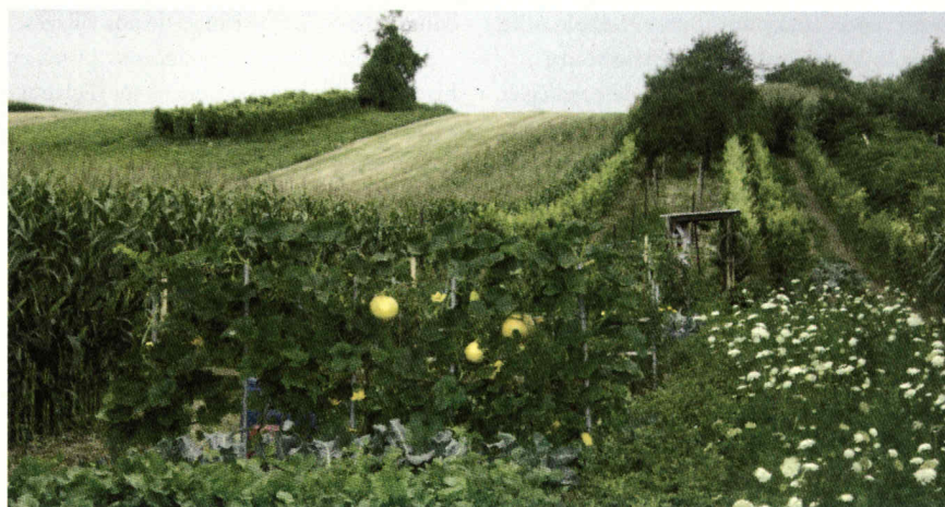
Le coteau remarquable du Hirschbari

ARBRES propose que ce réseau de haies ou de bocage, dernier vestige du Brischried soit préservé par une protection de type EBC (espace boisé classé) qui en garantira l'existence pour les générations futures.