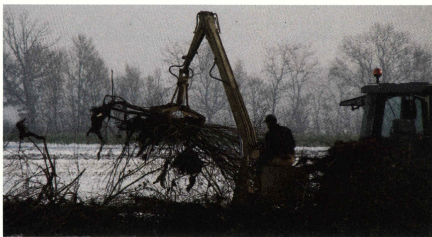
Stop à la destruction des haies et bocages !

(1) charte distribuée à l'ensemble des candidats aux dernières élections communales.