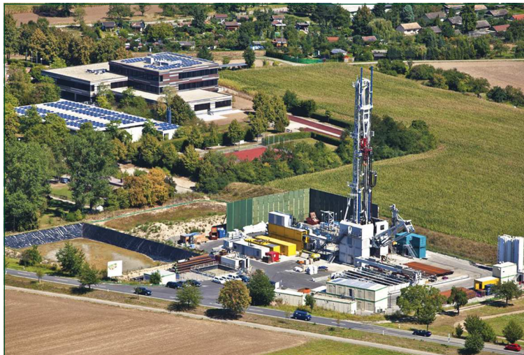
La foreuse de Fonroche sur le site de Vendenheim

Le projet de Vendenheim avance avec le forage du second puits. Le premier puits a démontré une ressource géothermale de plus de 200° C et un débit supérieur aux attentes. Le forage s'est déroulé sans aucun incident vis à vis de l'environnement et du voisinage, avec une surveillance permanente de l'opérateur Fonroche Géothermie et des services de l'État. La chaleur géothermale va servir à produire à la fois de l'électricité et de la chaleur pour les communes de Vendenheim et Reichstett, au nord de l'Eurométropole de Strasbourg. Plus de 20 000 habitants pourront bénéficier à terme de cette chaleur renouvelable à un prix maîtrisé. Fin 2019, l'appareil de forage se déplacera sur l'Ouest de Strasbourg pour forer le deuxième projet de Fonroche Géothermie, qui aura pour objectif d'alimenter en chaleur les communes environnantes et les réseaux de chaleur de l'Ouest de Strasbourg.