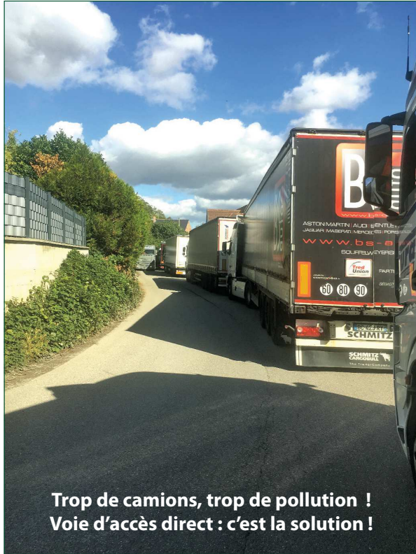
Trop de camions, trop de pollution ! Voie d'accès direct : c'est la solution !

La construction d'une voie d'accès direct à la briqueterie permettrait aux poids-lourds d'éviter le quartier Notre-Dame et la rue Bourgend. Une pétition signée, en octobre dernier, par 460 habitants, soit un quart de la population, demande que cessent ces nuisances quotidiennes !